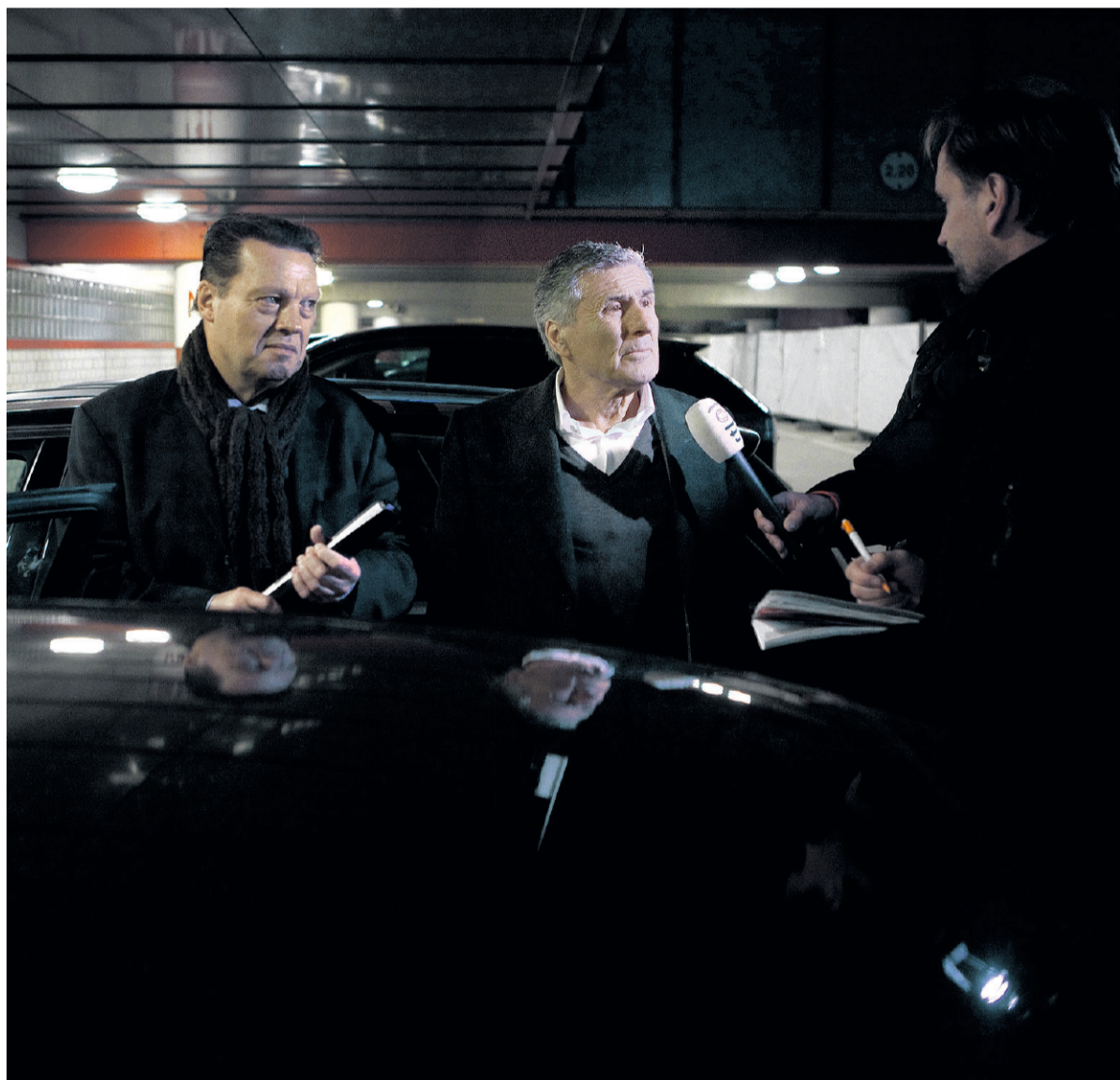
Oud-Ajaxspeler Sjaak Swart gisteravond na de Ajax-ledenraad, waar onder meer werd gepraat over de benoeming van Louis van Gaal tot algemeen directeur. Swart is tegen: „Directeur? Niet hier”, zei hij.